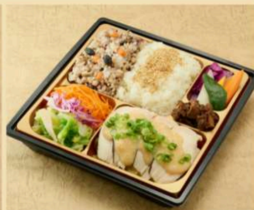
鶏胸肉の優しい火入れ

豚肉の中に水分を閉じ込める様にゆっくり 火入れしました、香り高い国産茶葉入り 十六穀米とお召し上がりください。