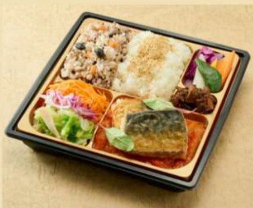
鯖のポワレ バスク風

脂を落とすように網焼きにしマスタードソースを添えました。 十六穀米と季節の野菜と共に お召し上がりください。