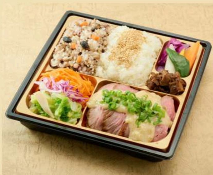
牛赤身のグリエ マスタードソース

鯖のポワレと牛赤身のグリエが入った贅沢な内容です。十六穀米は旬の魚介類をいれた炊き込みご飯です。季節の野菜と共に お召し上がりください。