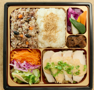
鶏胸肉の優しい火入れ 十六穀米とバーニャカウダ ¥1620(税込)

豚肉の中に水分を閉じ込める様にゆっくり火入れしまし た。香り高い十六穀米とお召し上がりください。