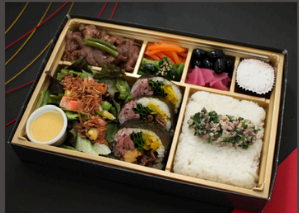
和牛トロたく贅沢焼肉御膳【増量】 2700円（税込） 和牛トロたく贅沢焼肉御膳 2160円（税込）

焼肉【増量】 ナムル2種 ネギ塩タンふりかけご飯 トロたく巻き3貫 オーロラサラダ 漬物 キャラメルケーキ