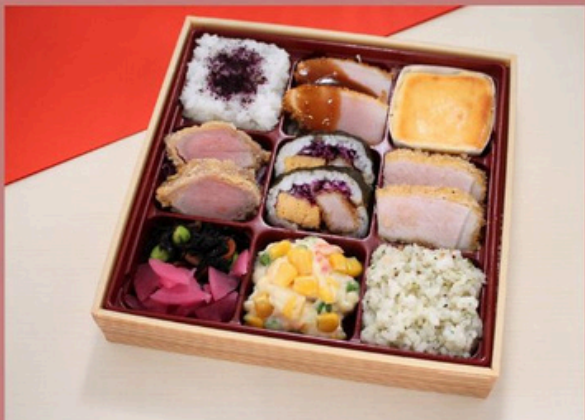
希少部位ヒレ・ロースカツ食べ比べ弁当 2700円 (税込)

ミシュランガイドブック掲載店「北新地とんかつ epais」 とんかつの概念を刷新。 厳選して仕入れた各地のブランド豚で、他にはないふっくらジューシーなトンカツを提供する人気店。