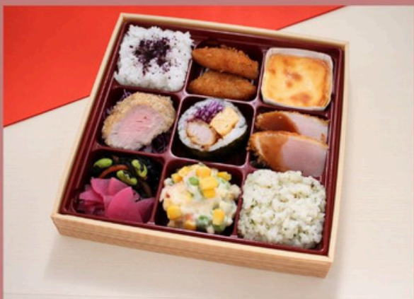
希少部位ヒレカツキンパ御膳 1800円 (税込)

ゆかりご飯 メンチカツ チーズケーキ ヒレカツ2切れ キンパ2切れ チキンカツ2切れ ひじき/漬物 ダイスサラダ パセリバターリゾット