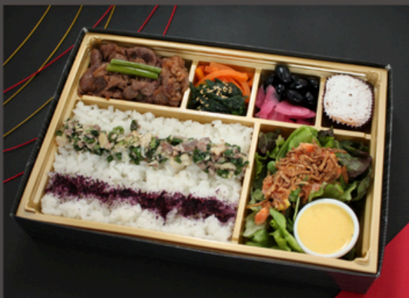
檸檬が効いた葱塩舌肉ふりかけ御膳 1500円（税込）

焼肉 ナムル2種 ゆかりご飯 トロたく巻き2貫 オーロラサラダ 漬物 キャラメルケーキ