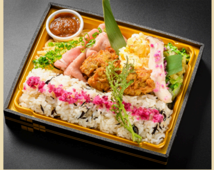
草木萌動 そうもくめばえいずる ¥1620(税込)

じゃがいもナムル 豚しゃぶ ザンギ 長芋サラダ エリンギみぞれ 白菜のかんずりあえ うめひじきご飯