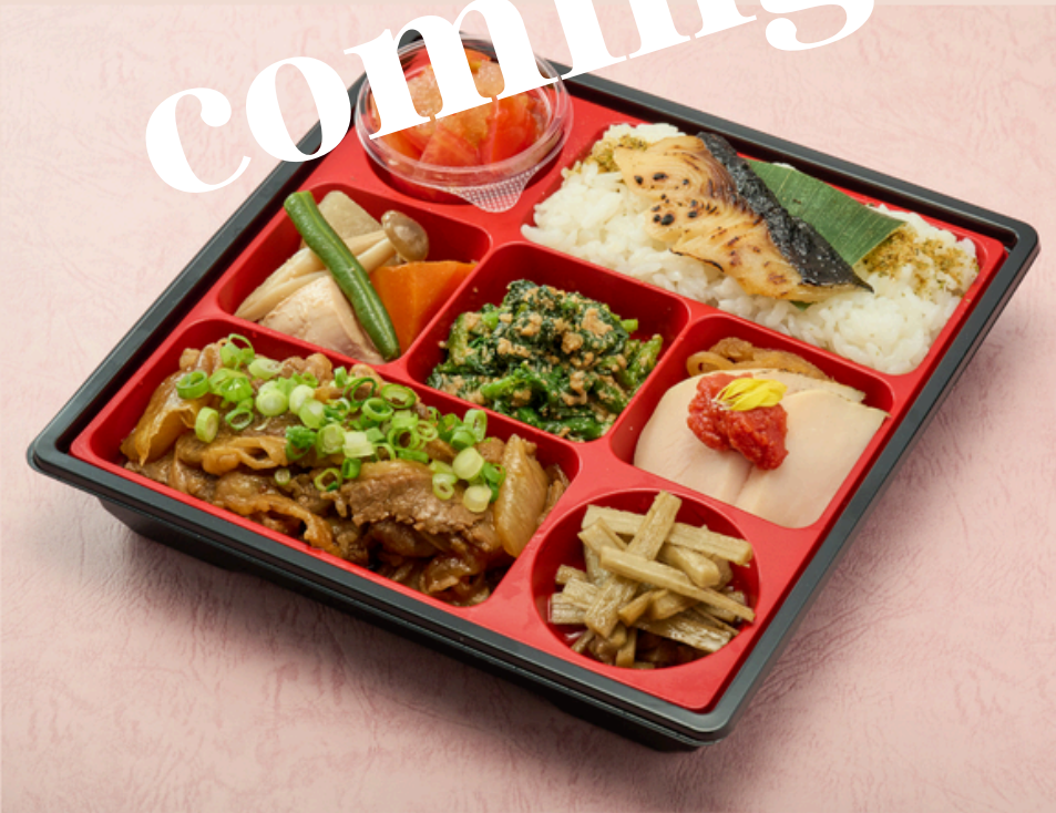
浪花亭特選弁当 ¥3000(税込)

西京焼き 菜の花胡麻和え 花しぐれ 蒸し鳥の梅肉ソース ごぼうのきんぴら うま煮 三杯酢のトマトジュレ