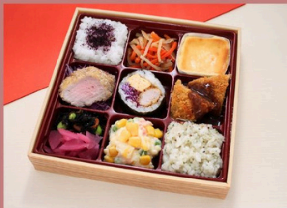
トンカツ9升御膳 1620円 (税込)

ゆかりご飯 メンチカツ チーズケーキ ヒレカツ キンパ チキンカツ ひじき/漬物 ダイスサラダ パセリバターリゾット