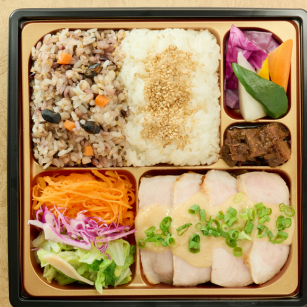
豚肉のロースト醤油マスタード ソース十六穀米とバーニャカウダ ¥1800(税込)

脂が乗った鯖をフライパンでパリッと焼き、パプリカと ベーコンの入ったトマトソースを添えました。 十六穀米と季節の野菜と共に召し上がりください。