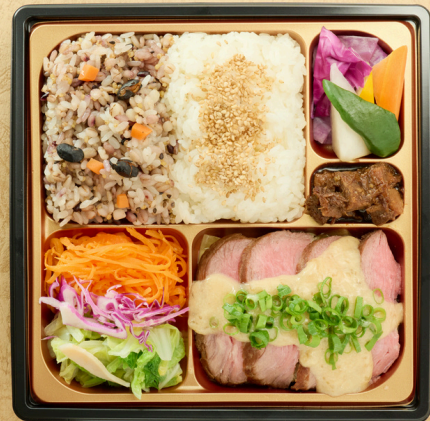
牛赤身のグリエ マスタードソース 十六穀米とバーニャカウダ ¥2160(税込)

鯖のポワレと牛赤身のグリエが入った贅沢な内容。 十六穀米は旬の魚介類をいれた炊き込みご飯に。