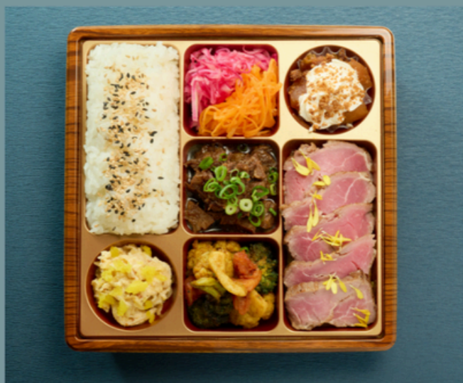
豚ロースのコンフィ -Plat porc-

牛カツレツ ゴママスタードソース キャロットラペ シュールージュ 鶏もものトマト煮込み 切り干し大根のサラダ 彩野菜のバーニャカウダー リンゴシュトゥルーゼル