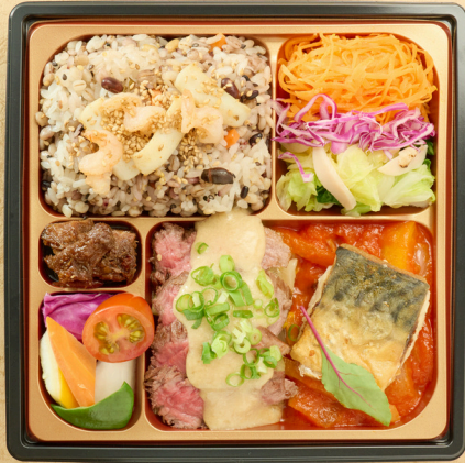
牛赤身と鯖のポワレ 魚介類の 炊き込みご飯 バーニャカウダ ¥3000(税込)

ミシュランガイド北海道2017にて一ツ星を獲得した、舘岡武士シェフ監修。 北海道の選び抜いた食材をより美味しく召し上がっていただけるよう 心掛けています。化学調味料に頼らない自然な味わいをお楽しみください。