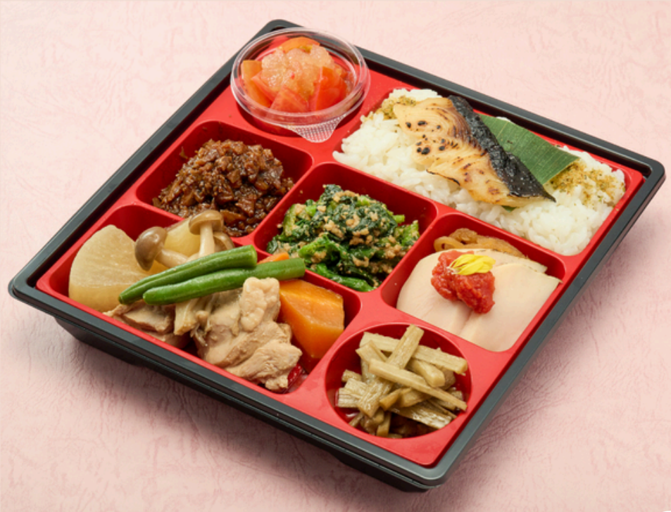
浪花亭お毛巻弁当 ¥2160(税込)

国内線ファーストクラスの贈答品も手掛ける名店の 「最高の和食と心を込めたおもてなし」をお楽しみいただけるお弁当です。