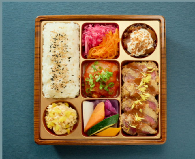
牛カツレツ-Plat boeuf- ¥2160(税込)

牛カツレツ 豚のコンフィ 鶏もも肉のトマト煮込み キャロットラペ シュールージュ 牛肉のラグー 魚介のカレー炒め 切り干し大根のサラダ 彩野菜のバーニャカウダー リンゴシュトゥルーゼル