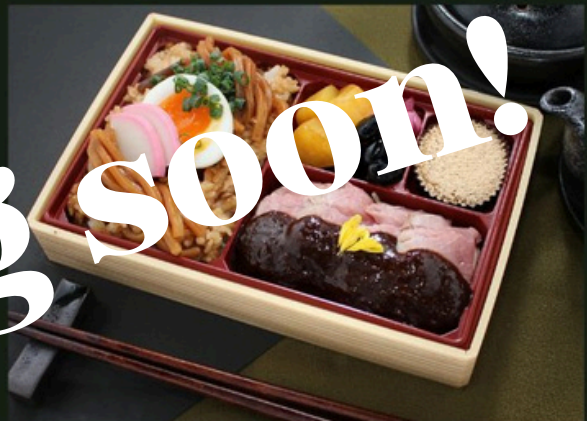
ヒレスターキ御膳 1800円 (税込)

味噌煮込みうどん飯 (麺入り) 大学芋 黒豆 漬物 黒糖ケーキ ヒレスターキ～100年八丁味噌ソース～【増量】