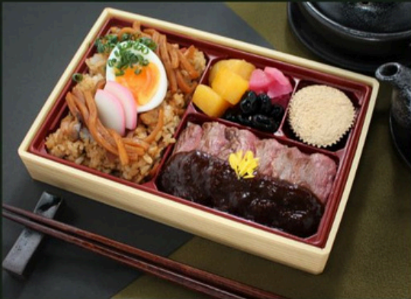
ビフテキ御膳【増量】 2700円 (税込)

大正14年創業の老舗味噌煮込みうどん店。名古屋を中心に多くのお客様に愛される山本屋。