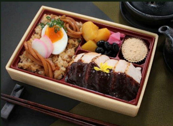
鶏ステーキ御膳【増量】 1620円 (税込)

味噌煮込みうどん飯 (麺入り) 大学芋 黒豆 漬物 黒糖ケーキ ヒレスターキ～100年八丁味噌ソース～