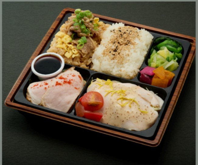
厳選ポークと牛焼肉弁当 【豚肉増量】