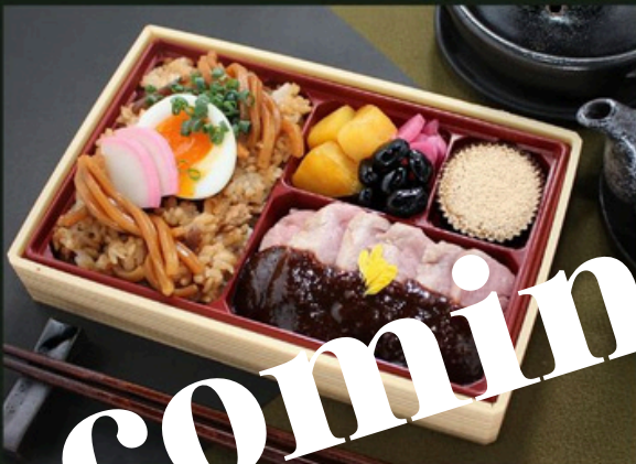
ヒレスターキ御膳【増量】 2160円 (税込)

味噌煮込みうどん飯 (麺入り) 大学芋 黒豆 漬物 黒糖ケーキ ビフテキ～100年八丁味噌ソース～