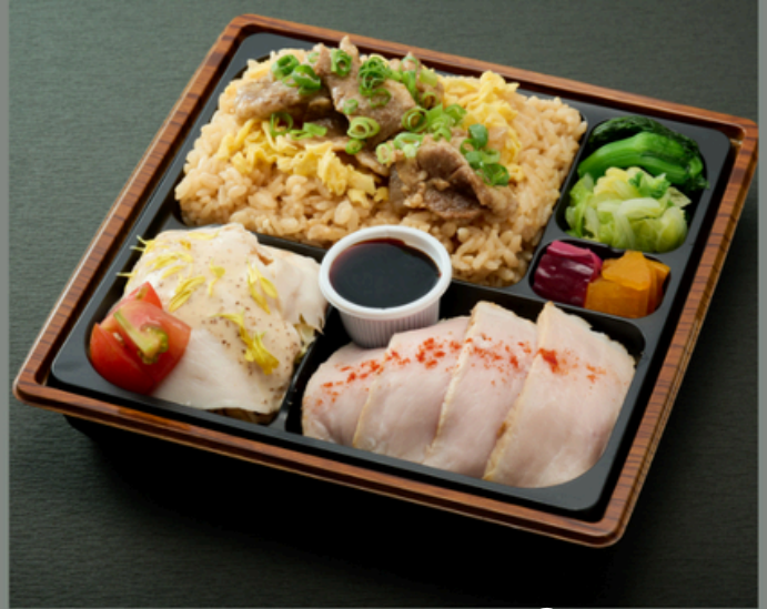
牛焼肉ビビンバと バンバンジーサラダ弁当 【肉増量】 ¥2700(税込)