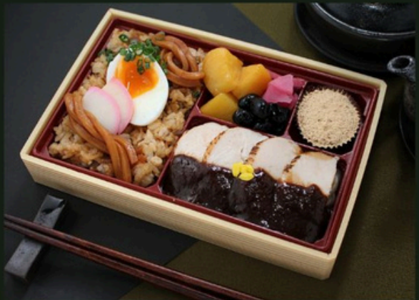
鶏ステーキ御膳 1500円 (税込)

味噌煮込みうどん飯 (麺入り) 大学芋 黒豆 漬物 黒糖ケーキ 鶏ステーキ～100年八丁味噌ソース～【増量】