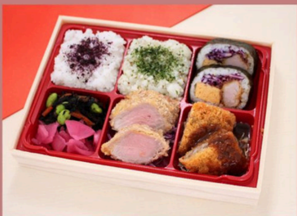
トンカツ6升御膳 1500円 (税込)

ゆかりご飯 きんぴら チーズケーキ ヒレカツ キンパ コロッケ ひじき/漬物 ダイスサラダ パセリバターリゾット