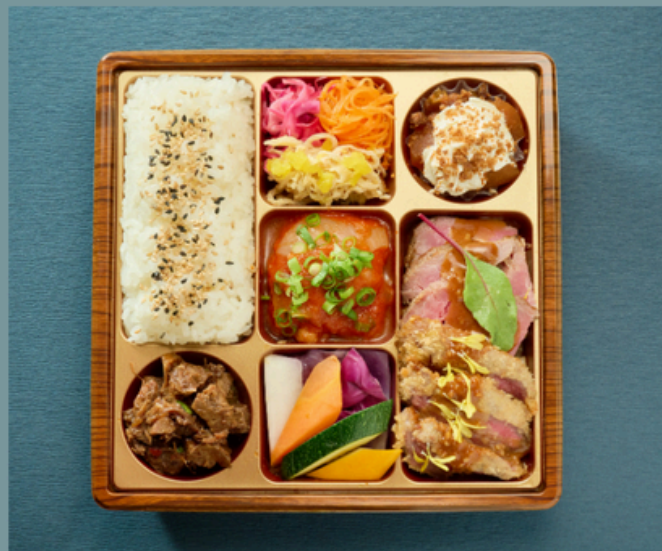
3種のメインmeli melo BOX ¥3000(税込)

ミシュランガイド北海道2017にて一ツ星を獲得した、meli meloのオーナーシェフ佐藤 大典 監修。 豊かな自然が育む北海道の食材と、パリで学んだモダンな フレンチ。 どこか懐かしい和のテイストとフレンチを融合させた、新たな驚きのある一品をお楽しみください。