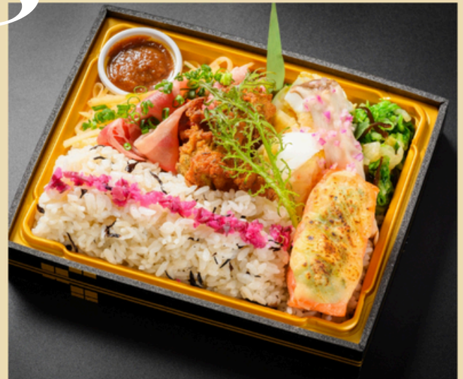
桃始笑 ももはじめてさく ¥2160(税込)

じゃがいもナムル 牛しゃぶ ザンギ 長芋サラダ エリンギみぞれ 白菜のかんずりあえ サーモンのちゃんちゃん焼き うめひじきご飯