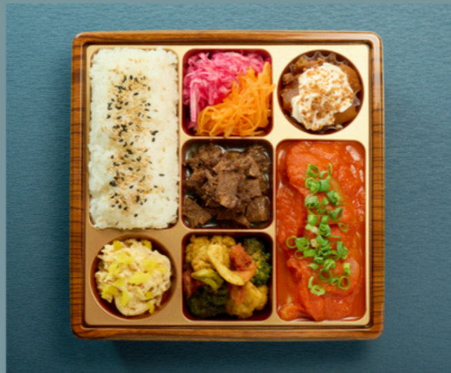
鶏もも肉と野菜のトマト煮込み -Plat poulet-

豚ロースのコンフィ キャロットラペ シュールージュ 牛肉のラグー 魚介のカレー炒め 切り干し大根のサラダ リンゴシュトゥルーゼル