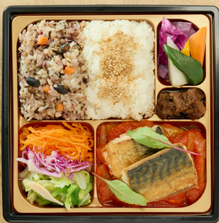
鯖のポワレバスク風 十六穀米と バーニャカウダ ¥2160(税込)

脂を落とすように網焼きにし、マスタードソースを 添えました。十六穀米と共に召し上がりください。