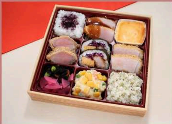
希少部位ヒレ・ロースカツ食べ比べ弁当 2700円 (税込)

ミシュランガイドブック掲載店「北新地とんかつ epais」 とんかつの概念を刷新。 厳選して仕入れた各地のブランド豚で、他にはないふっくらジューシーなトンカツを提供する人気店。