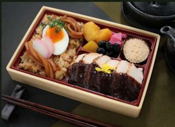
鶏ステーキ御膳【増量】 1620円 (税込)

味噌煮込みうどん飯 (麺入り) 大学芋 黒豆 漬物 黒糖ケーキ ヒレステーキ～100年八丁味噌ソース～