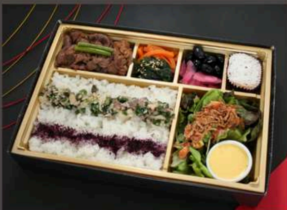
檸檬が効いた葱塩舌肉ふりかけ御膳 1500円（税込）

焼肉 ナムル2種 ゆかりご飯 トロたく巻き2貫 オーロラサラダ 漬物 キャラメルケーキ