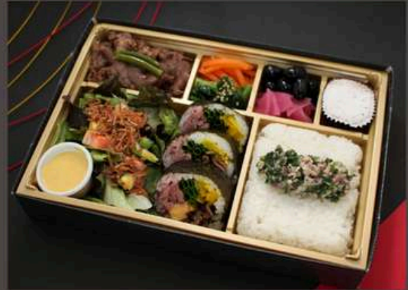
和牛トロたく贅沢焼肉御膳【増量】 2700円（税込） 和牛トロたく贅沢焼肉御膳 2160円（税込）

焼肉【増量】 ナムル2種 ネギ塩タンふりかけご飯 トロたく巻き3貫 オーロラサラダ 漬物 キャラメルケーキ