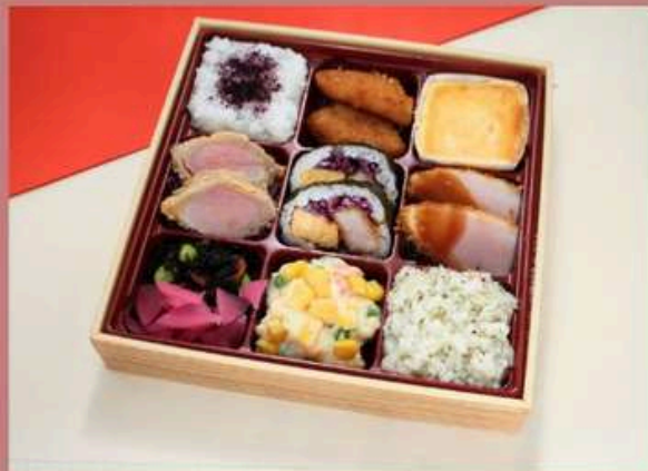
希少部位ヒレ弁当 2160円 (税込)

ゆかりご飯 チキンカツ2切れ チーズケーキ ヒレカツ2切れ キンパ2切れ ロースカツ2切れ ひじき/漬物 ダイスサラダ パセリバターリゾット