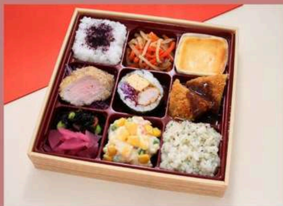
トンカツ9升御膳 1620円 (税込)

ゆかりご飯 メンチカツ チーズケーキ ヒレカツ キンパ チキンカツ ひじき/漬物 ダイスサラダ パセリバターリゾット