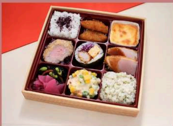
希少部位ヒレカツキンパ御膳 1800円 (税込)

ゆかりご飯 メンチカツ チーズケーキ ヒレカツ2切れ キンパ2切れ チキンカツ2切れ ひじき/漬物 ダイスサラダ パセリバターリゾット