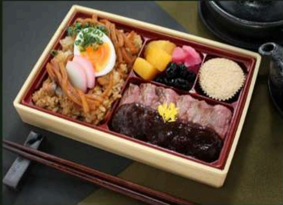
ビフテキ御膳【増量】 2700円 (税込)

大正14年創業の老舗味噌煮込みうどん店。名古屋を中心に多くのお客様に愛される山本屋。