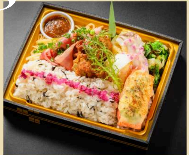
桃始笑 ももはじめてさく ¥2160(税込)

じゃがいもナムル 牛しゃぶ ザンギ 長芋サラダ エリンギみぞれ 白菜のかんずりあえ サーモンのちゃんちゃん焼き うめひじきご飯