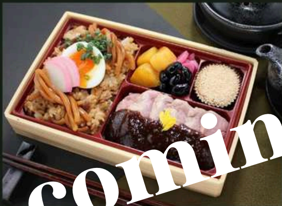
ヒレステーキ御膳【増量】 2160円 (税込)

味噌煮込みうどん飯 (麺入り) 大学芋 黒豆 漬物 黒糖ケーキ ビフテキ～100年八丁味噌ソース～