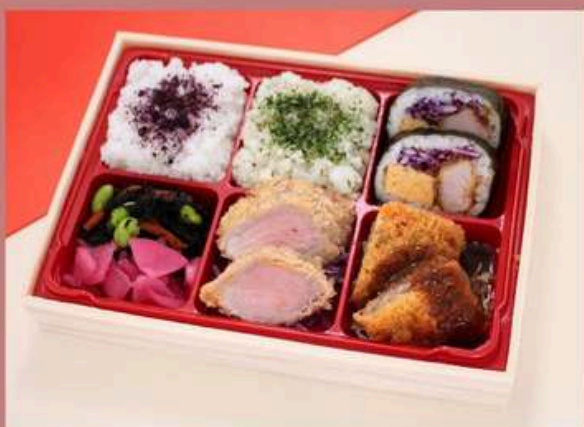
トンカツ6升御膳 1500円 (税込)

ゆかりご飯 きんぴら チーズケーキ ヒレカツ キンパ コロッケ ひじき/漬物 ダイスサラダ パセリバターリゾット