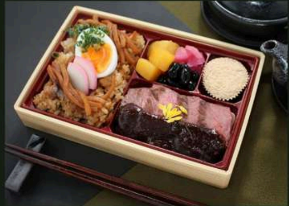
ビフテキ御膳 2500円 (税込)

味噌煮込みうどん飯 (麺入り) 大学芋 黒豆 漬物 黒糖ケーキ ビフテキ～100年八丁味噌ソース～【増量】