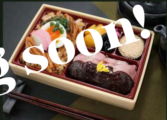
ヒレステーキ御膳 1800円 (税込)

味噌煮込みうどん飯 (麺入り) 大学芋 黒豆 漬物 黒糖ケーキ ヒレステーキ～100年八丁味噌ソース～【増量】