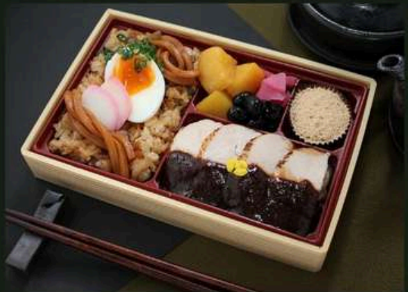
鶏ステーキ御膳 1500円 (税込)

味噌煮込みうどん飯 (麺入り) 大学芋 黒豆 漬物 黒糖ケーキ 鶏ステーキ～100年八丁味噌ソース～【増量】