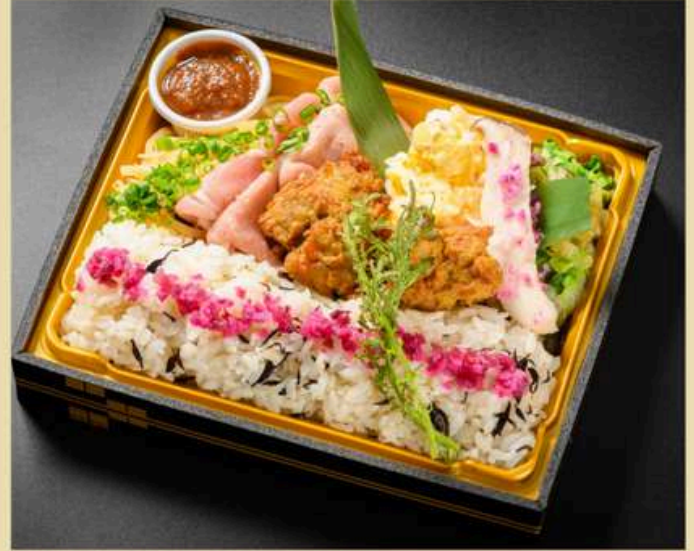
草木萌動 そうもくめばえいずる ¥1620(税込)

じゃがいもナムル 豚しゃぶ ザンギ 長芋サラダ エリンギみぞれ 白菜のかんずりあえ うめひじきご飯