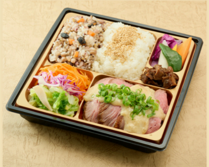
牛赤身のグリエ マスタードソース

鯖のポワレと牛赤身のグリエが入った贅沢な内容です。十六穀米は旬の魚介類をいれた炊き込みご飯です。季節の野菜と共に お召し上がりください。