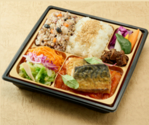
鯖のポワレ バスク風

脂を落とすように網焼きにしマスタードソースを添えました。 十六穀米と季節の野菜と共に お召し上がりください。