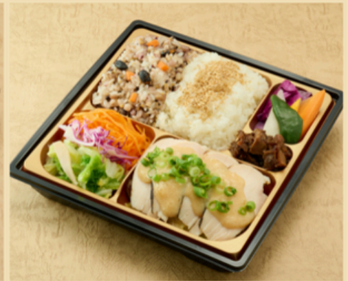
鶏胸肉の優しい火入れ

豚肉を中に水分を閉じ込める様にゆっくり火入れしました、香り高い国産茶葉入り十六穀米とお召し上がりください。